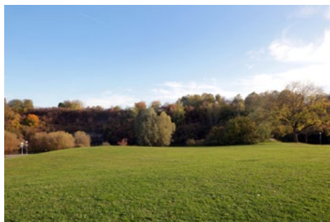
↑↑ Modell »I'm after me« ↑ Stadtpark Leonberg